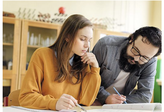
Das Geschlecht der Lehrperson hat weder Einfluss auf die Motivation der Schülerinnen und Schüler noch auf die Gestaltung des Unterrichts.

In ihrem Vortrag wies sie auch darauf hin, dass die Kultur der Einrichtung Schule Geschlechterunterschiede intensivieren könne. Zu dieser Erkenntnis passt die Forderung, die das Projektteam um Herzog und Makarova am Schluss ihrer Projektzusammenfassung stellt: Es sollen Ausbildungsmodule entwickelt werden, die angehende Lehrpersonen der Sekundarstufen I und II für die Bedeutung eines geschlech-